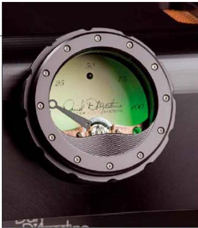
Am Zeigerinstrument der Vorstufe kann man die Stellung des Pegelstellers zumindest abschätzen

XLR-Verbindern etwas ausrichten. Die Vorstufe verfügt übrigens über sechs Eingänge, und auch wenn einer davon mit „Phono“ beschriftet ist, verbirgt sich dahinter ein normaler Hochpegelanschluss. Ausgänge gibt's zwei, außerdem Anschlüsse für Home-Theater-Spielereien. Details zur Schaltungstechnik und zum Aufbau? Erspare ich Ihnen ausnahmsweise. Sie dürfen sicher sein: Es stecken Grips und Aufwand drin.