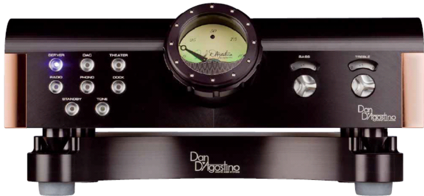
Die zweiteilige D'Agostino-Vorstufe gehört haptisch und optisch zweifellos zu den aufregendsten Maschinen am Markt

So reichen den zwölf Leistungstransistoren pro Seite denn auch relativ bescheiden dimensionierte Kupferblöcke zur Wärmeabfuhr. Senkrechte Bohrungen vergrößern die wirksame Oberfläche und erzeugen einen gewissen Kamineffekt, auch der hilft beim Kühlen. Praktisch funktioniert das ausgezeichnet, die Endstufe wird auch bei härterer Gangart kaum mehr als handwarm.