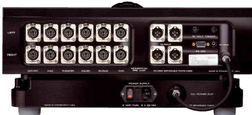
Für den Signalanschluss gibt's ausschließlich XLR-Buchsen. Wer unsymmetrisch anschließen will, muss mit Adaptern arbeiten

außen um den Tubus des Zeigerinstrumentes ausgeführt, läuft superleicht und sorgt bei jeder Betätigung für das Klicken einer Vielzahl eingebauter Relais, die vollsymmetrisch Festwiderstände umschalten. Und dann gibt's da noch, man höre und staune, Klangregler. Bass und Höhen. Ebenfalls mit geschalteten Widerständen realisiert. Und natürlich überbrückbar. Der Purist mag gequält aufschreien, in der Praxis mag das aber durchaus mehr klangliche Probleme lösen als es verursacht. Die Momentum-Vorstufe ist, man sieht's erst auf den zweiten Blick, zweiteilig aufgebaut. Im leicht mit einem schlichten Sockel zu verwechselnden Unterbau steckt die Stromversorgung. Die Netzteilbehausung ist schlicht aus einem dicken Alublock herausgefräst, während das Verstärkergehäuse aus dicken Blechen zusammengefügt ist. Bei den Anschlüssen gibt sich D'Agostino wenig kompromissbereit: Wenn du keine symmetrischen Quellen hast, dann musst du dir halt Adapter besorgen. An Vor- und Endstufe jedenfalls kann man nur mit