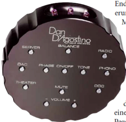
Bei der Fernbedienung findet sich die Form der „Bullaugen“ wieder