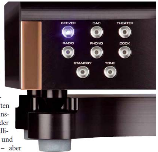
Die Momentum-Vorstufe verfügt über sechs Eingänge

So einen Hörtest fängt man nicht mit einer hübschen weiblichen Gesangsstimme an. Hier stehen ein paar Hundert Kilo Schwermetall, hier gibt's Leistung und Membranfläche. Das großartige Monkey3-Album „The 5th Sun“ ist genau das Richtige, um den ersten Übermut abzureagieren. Was haben Sie erwartet? Dass es bumst und rumst? Tut es nicht. Aber es hämmert. Staubtrocken, abartig sauber und diszipliniert. Schon mal gehört, was ein Drumstick auf dem Rand einer Snaredrum tut? Hier können Sie's mit glaubhafter Live-Dynamik erleben. Leise hören? Ritt nicht. Noch nicht. Da geht noch was. Und irgendwann sitze ich auf dem Sofa und werde mir darüber klar, dass ich gerade aktiv die